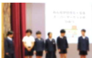
学習発表会 3・4年生