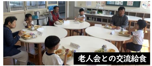
老人会との交流給食