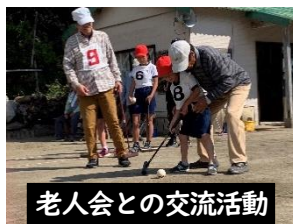
老人会との交流活動