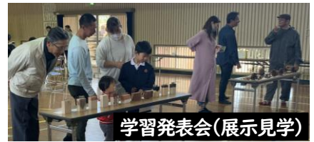
学習発表会(展示見学)